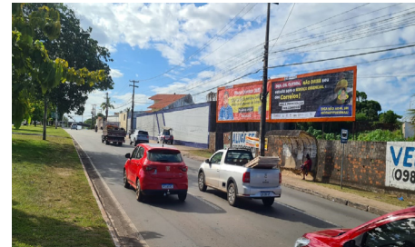
Av. Franceses px SINTECTMA