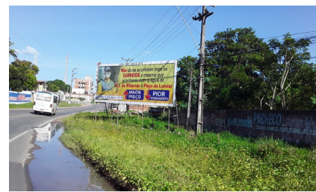
São José de Ribamar