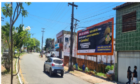
Pq. do Bom menino - Centro de S. Luís